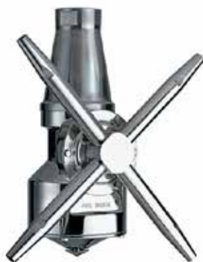
Mixers och omrörare