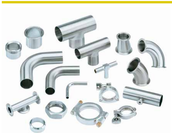
Fittings och rör