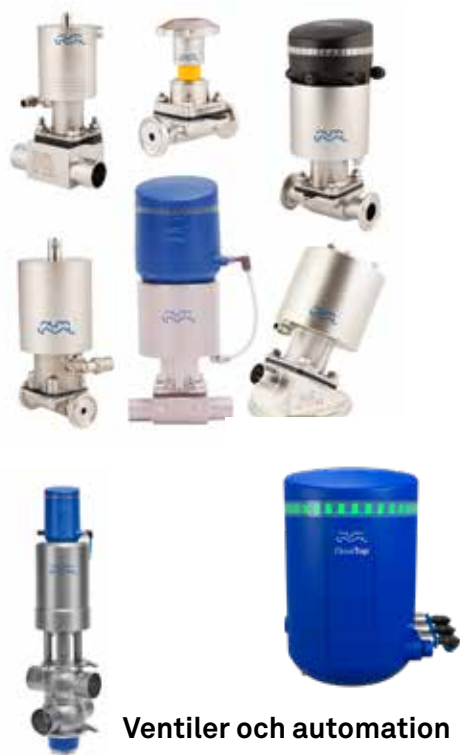
Ventiler och automation